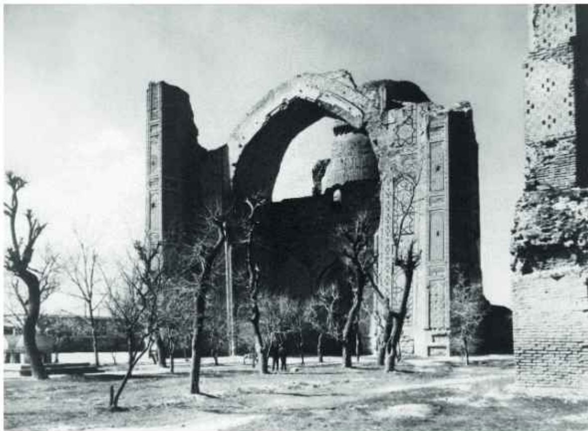
Bibixonim masjidi xarobalari. XX asr boshlari.

Surat mazmuni bilan she'r va sochmada aks etgan fikrlarni bir-biriga qay darajada mutanosibligini aniqlashga harakat qiling.